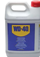
Kanister 5 Liter