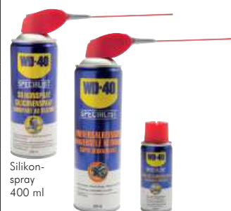
Silikonspray 400 ml