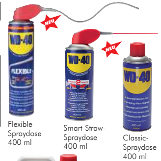
Flexible-Spraydose 400 ml