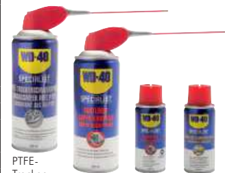
PTFE-Trockenschmierspray 400 ml