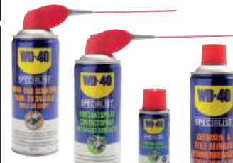
Bohr- und Schneidöl 400 ml