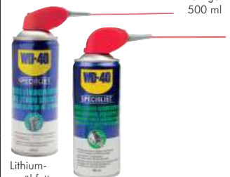
Lithiumsprühfett 400 ml