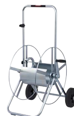
Typ WS SAF 34-80