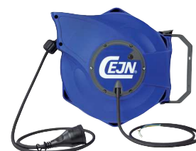
Typ KAC 10315 / KAC 17315