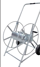
Typ WS SAF 10