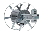
Typ WS WA 34