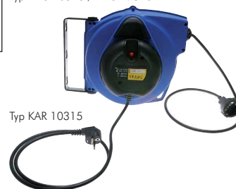
Typ KAR 10315