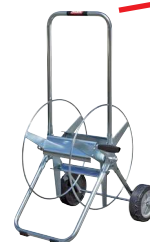
Typ WS SAF 34