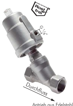
Antrieb aus Edelstahl

Werkstoffe: Körper: 1.4408, Dichtungen: PTFE/FKM Temperaturbereich: -10°C bis max. +60°C Medien: Druckluft, neutrale Gase, Wasser, Öle, schwache Säuren und Laugen Schaltstellung: Nullstellung geschlossen (NC) Durchflussrichtung: mit dem Medienstrom schließend (nicht empfohlen für Flüssigkeiten bei hohen Fließgeschwindigkeiten)