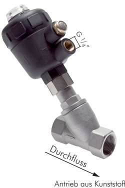
Antrieb aus Kunststoff