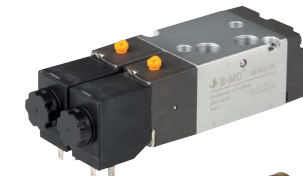
5/2 Wege (Impulsventil)