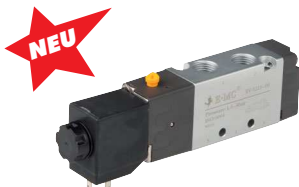
5/2 Wege (Federrückstellung)

Lieferumfang: RV-Ventil wird ohne Schrauben und Dichtungen geliefert. Bei Bedarf Schrauben und Dichtung (Typ V51-REP bzw. V52-REP) hinzubestellen. SR-Ventil wird einschließlich Schrauben und Dichtungen geliefert. Hinweis: Diese Ventile können einfach auf Ventilplätze eines bestehenden Ventilterminals aufgeschraubt werden um den Funktionsumfang eines Standardterminals zu erweitern oder ein defektes Ventil zu ersetzen.